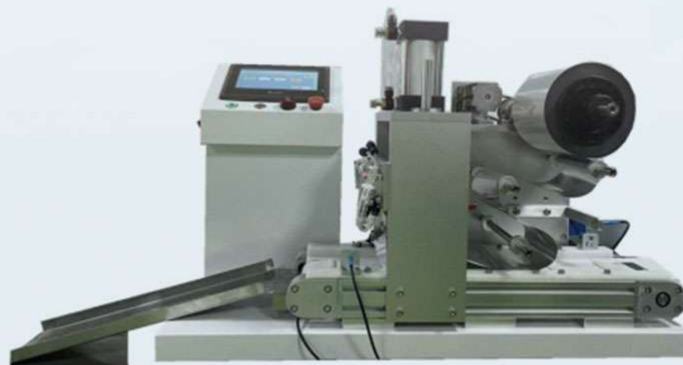
BKB-RF05 热封设备 (卷材膜)