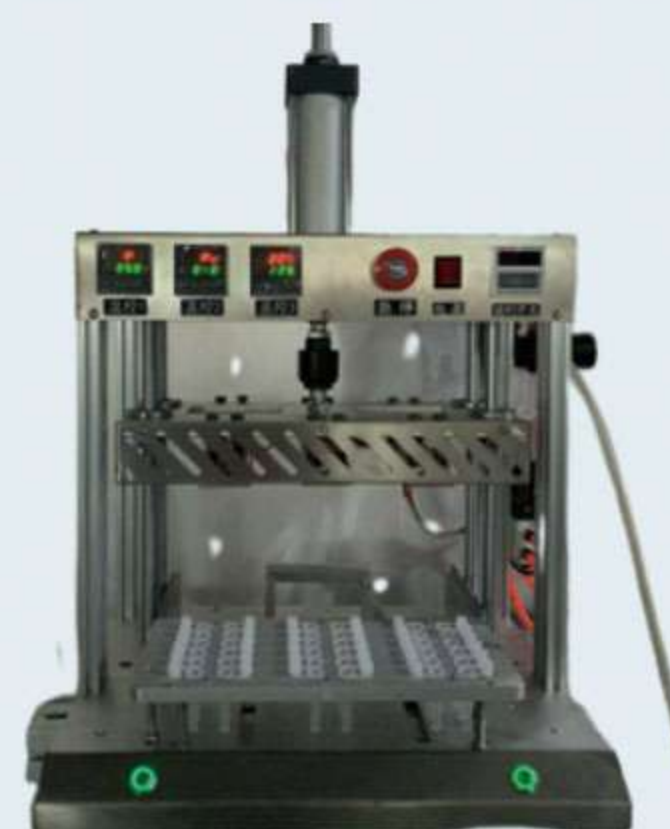
BKB-RF04-DS 单耳双耳管热封设备